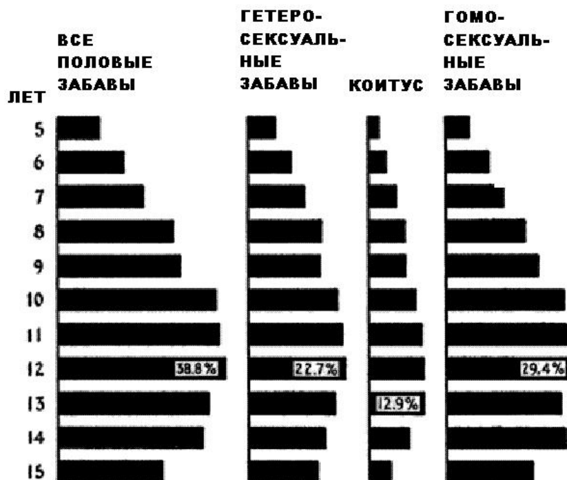
Рис. 25: Распределение мальчиков, играющих эротически, по возрасту.

Гомосексуальные контакты развертываются в порядке: демонстрация междунужья, ручные манипуляции, анальные либо оральные контакты, проникновение в уретру (табл. 27). Эксгибиционизм — это форма гомоконтакта самая распространенная (99,8% всех историй о гомосеянности). С очень маленького возраста, когда такое случайно, непроизвольно, неэффективно. Самый срок эксгибиционизма — подростковый возраст и ранняя юность. У ценящих автостимуляцию, в удовольствиях искусственных. К этому возрасту не демонстрировать способности даже стыдно, поэтому мальчики конфиденциально либо в группе хвастают ловкостью рук. Когда последний вариант, эксгибиционизм иногда всегрупповой. Скорее всего, зрители восприимчивей не наедине. Некоторые ребята делают это до самого выпуска. Даже формируя тайное общество демонстративных онанистов. Сторонясь гомофобии. К этому времени можно быть полноценным гомосексуалистом, однако себе не признаваться.