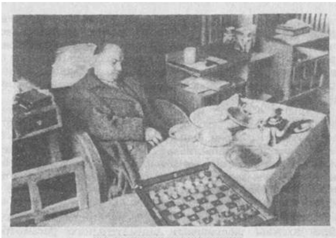
Посмертная фотография А. Алехина.