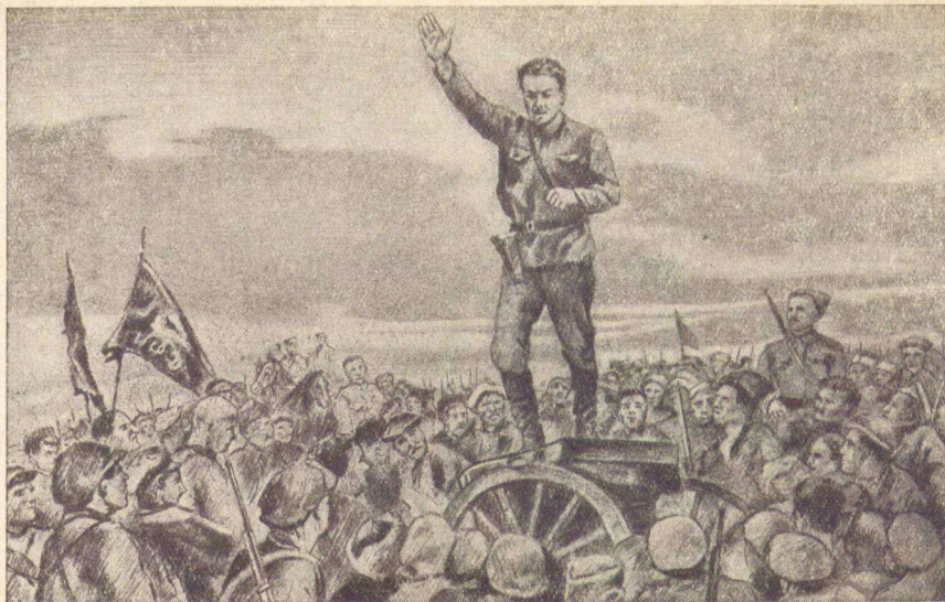
Товарищ Лазо говорит речь.