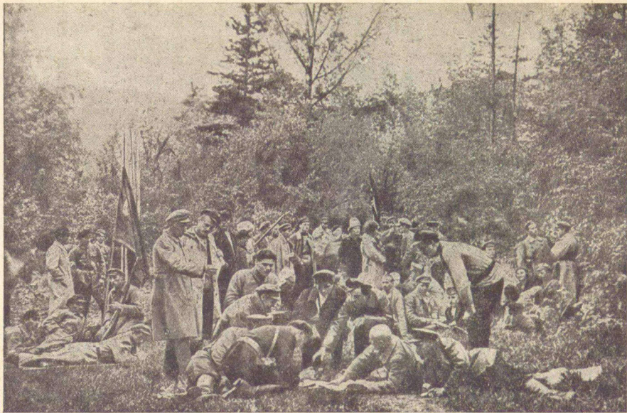
Партизанский отряд перед выступлением.