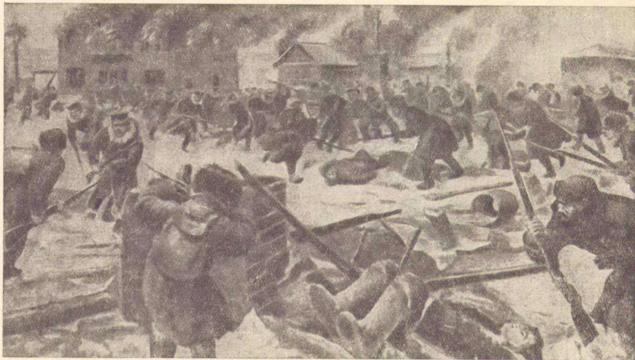
Бой партизан с японскими войсками на Дальнем Востоке.