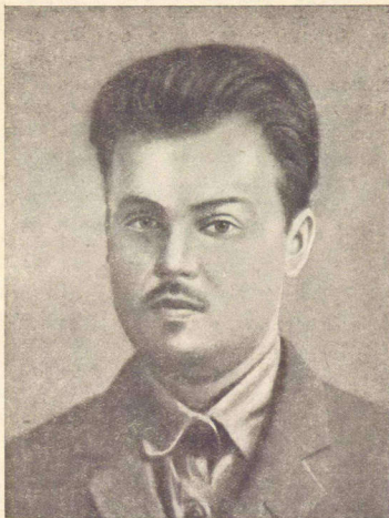
Товарищ Сергей Лазо.