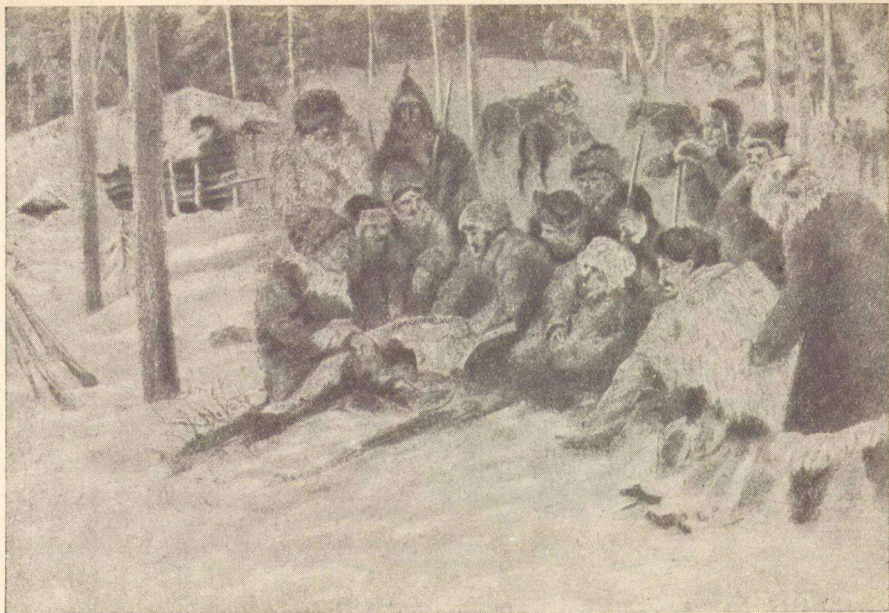
Партизанский штаб в тайге.