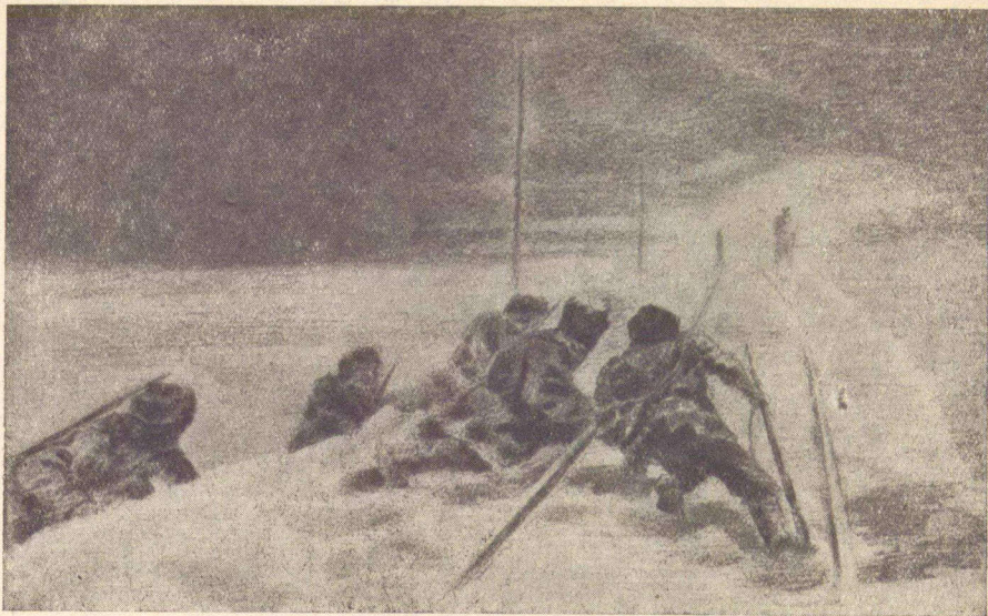
Партизаны разрушают железнодорожный путь.