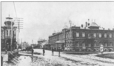
«Номера М. И. Дядина» в г. Челябинске, где в 1918—1919 гг. размещалось управление 3-го Уральского армейского корпуса, а затем — штаб Западной армии. Открытка начала XX века