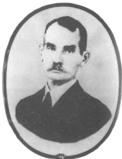
М. В. Ханжин. Фото 30-х годов XX века