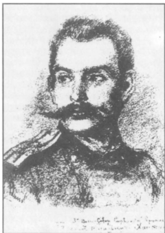
Портрет командира 4-й батареи Восточно-Сибирской артиллерийской бригады подполковника М. В. Ханжина. Маньчжурский фронт. Русско-японская война