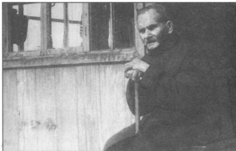
Одна из последних фотографий М. В. Ханжина