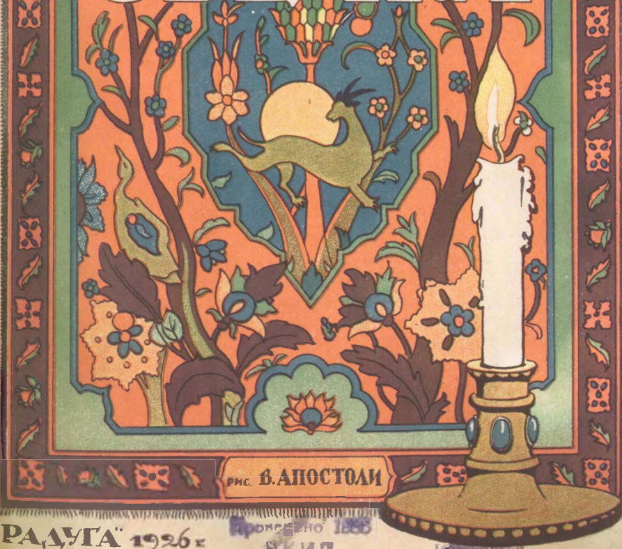
РИС. В. АПОСТОЛИ