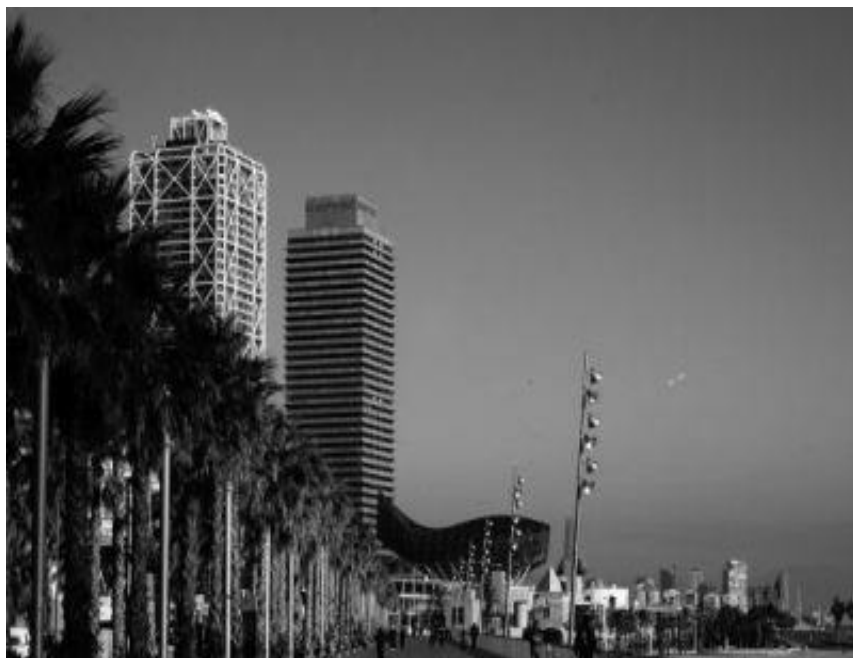
Torre Mapfre y Hotel Arts en la Villa Olímpica