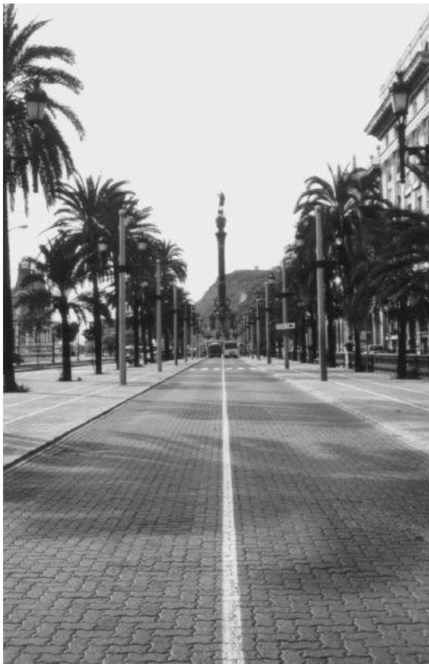
Paseo de Colón con la estatua de Colón al fondo