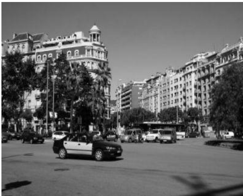
Taxi de Barcelona