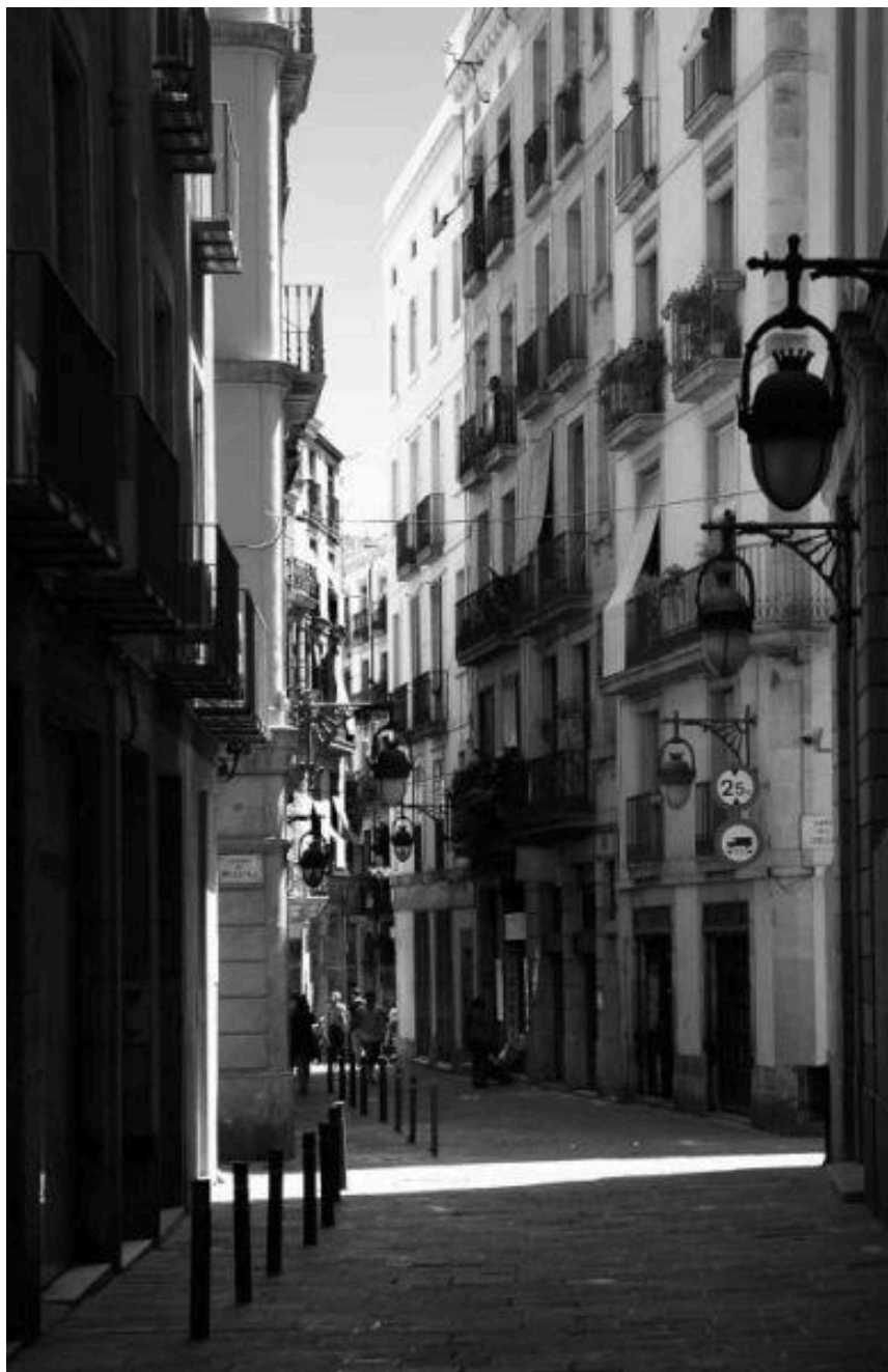
Barrio del Raxal