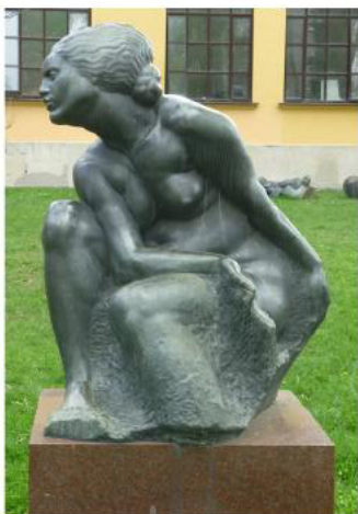
Вдова. Бронза. 1908 г. Загреб. Хорватия стр. 61-63