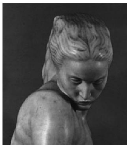
Воспоминание. 1908 г.