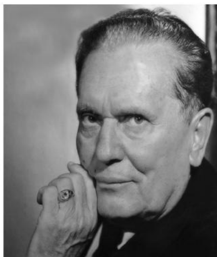
Иосиф Броз Тито. 1959 г.

Что означала эта странная фраза. Вряд ли Тито надо было напоминать