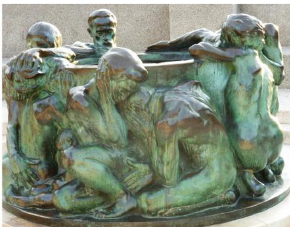
Фонтан жизни. Бронза. 1905г. Загреб. Хорватия стр. 84-90