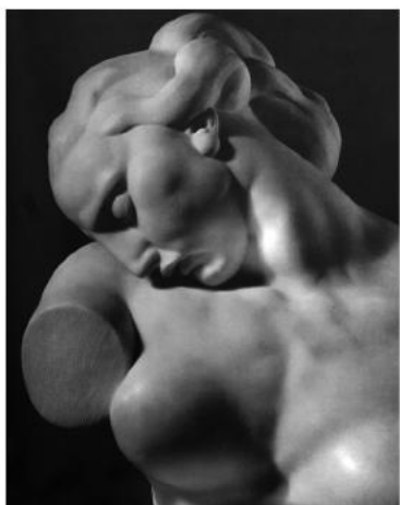
Психея. 1927 г.

тельная. Мештрович все более сосредотачивается на творчестве и преподавании и все больше ощущает себя человеком мира. Неслучайно во время празднования своего пятидесятилетия он написал: «Я прошу прощения у моей родной бессмертной матери Хорватии, у ее сестры-близнеца Сербии, у моего отчества Югославии и у всех славян за то, что посвящаю свое скромное творчество: молитвы, песни и протесты не им, а всему человечеству».