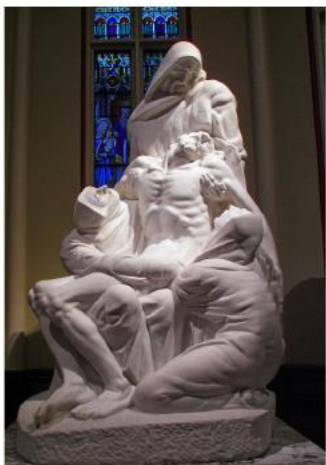
Пиета. Мрамор. 1946 г. Ротчестер. США стр. 45-49