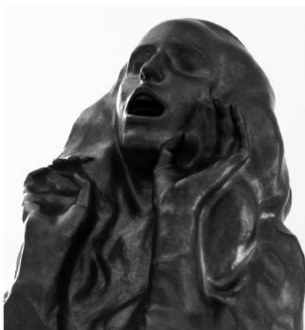
Поющая девочка. 1906 г.

По этому, он не пропал. Как не пропали и многие другие его сверстники приехавшие искать счастье в столице двуглавой империи. Вена первого года нового столетия была не только Веной господ танцующих Штрауса, но и Веной Малера, Фрейда, Мештровича и Гитлера. Тогда еще Шикельгубера.