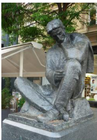
Памятник Николе Тесле. Бронза. 1946 г. Загреб. Хорватия стр. 64-66