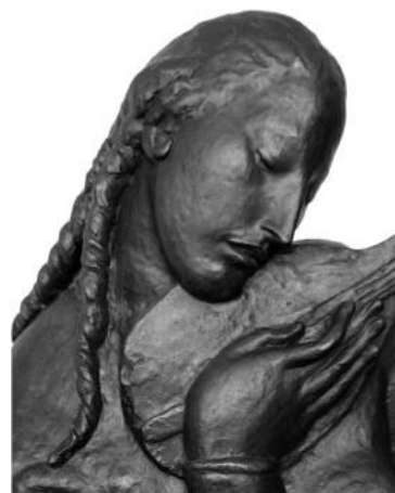
Девушка с лютней. 1927 г.