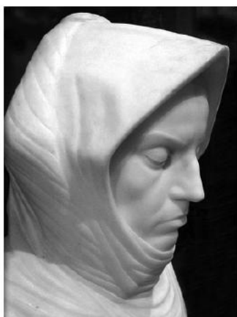
Моя мать. 1909 г.