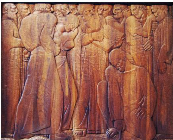
Христос и грешница Дерево. 1939-1941 гг. Сплит. Хорватия стр. 50-51