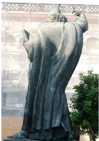
Памятник Гргуру Нинскому. Бронза. 1929г. Сплит. Хорватия стр. 79-81