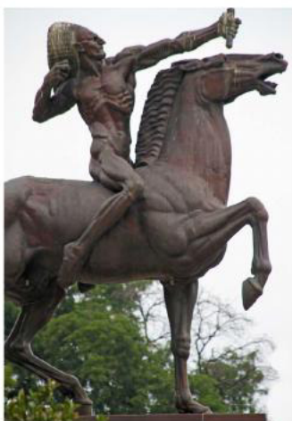
Индеец. Бронза. 1928 г. Гранд-парк. Чикаго. США стр. 68