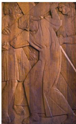
Несение креста. Дерево. 1939-1941 гг. Сплит. Хорватия стр. 52