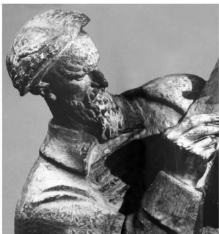
Марко Марулич. 1924 г.