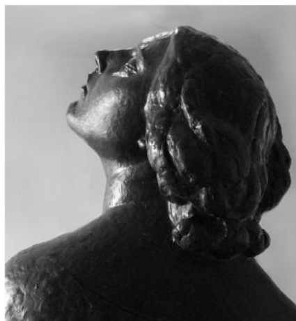
Молящаяся женщина. 1935 г.

В тоже время, проявляется и лирическая сторона его таланта в тонких и поэтических работах «Отдыхающая женщина», «Женщина у моря», «Психея», «Девушка с лютней», «Далекие