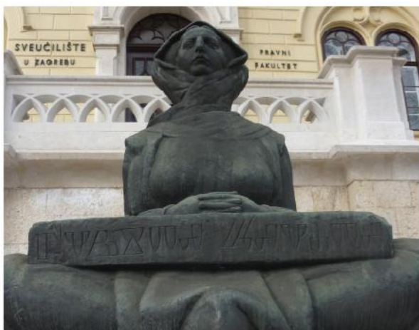
История Хорватов. Бронза. 1932 г. Загреб. Хорватия стр. 82-83