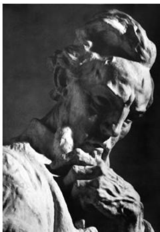
Лука Ботич. 1905 г.