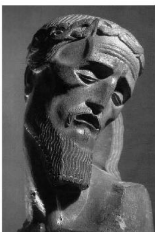
Голова Христа. 1913 г.

в начале XX века Иваном Мештровичем портрете Толстого, групповом портрете «Семья» и других работах тех лет, в том числе и в памятнике Луке Ботичу в Сплите и «Фонтане жизни» в Загребе.