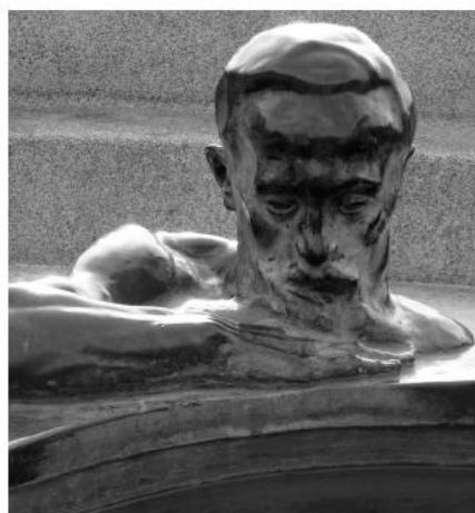
Фонтан жизни. 1905 г.