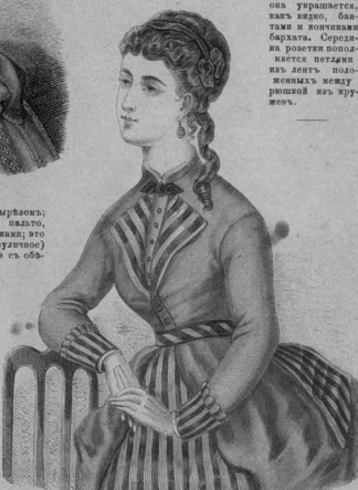
37. Высокій лѣвъ съ полнотами отворотами

кружево розетки; она удерживается, какъ видно, бантами и кончиками бархатца. Середина розетки поднимается петлями изъ ленте положенныхъ между розеткой изъ кружева.