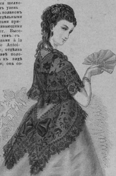
31. Мантилья широкъ изъ кружевъ.

Весь нарядъ состоитъ изъ сѣраго платья съ широкими шелковыми воланами и бантами. Нижняя юбка обшита широкими шелковыми воланами; верхняя юбка образуетъ спереди четырехугольный передникъ, сзади разлетъ; обшита шелковыми узенькими воланами и отбѣланными бантами придерживающими разлетъ. Высокой тѣло съ указками à la Marie Antoinette; отбѣлка на лѣвой половине изъ видъ ешшо; она со-