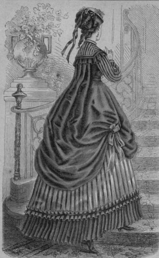
30. Наряд для вечера для молодыхъ дамъ.