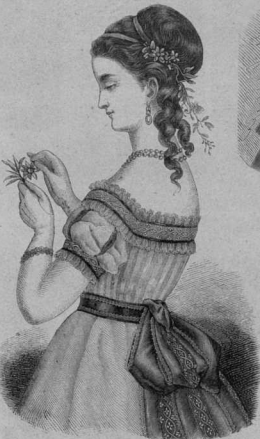
35. Вышивки рубашечки съ погонью.

безъ рукавовъ съ четырехугольными вышивками; спереди сдѣлано изъ видъ прилегающаго пальто, сзади на спинѣ падаетъ широкими складками; это мантия сдѣлана изъ гласе Монпеланъ (дуэличное) красное съ черными; воротъ обшита бѣ съ обшитахъ сторонахъ съ красивыми кантиновъ; около обшитою юбки изъ материи; внизу мантия подобрана съ боковъ бантами. Круглая шалька съ цвѣтами и лентами. Несма взаимно такой нарядъ сдѣлать чернымъ съ бѣлымъ или чернымъ съ цвѣтами полосками изъ полушерстяной материи съ мантия изъ сѣраго вѣрова, сѣраго шерстяного репса или чернаго шелковаго репса.