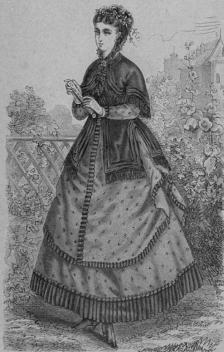
29. Нарядъ для гулянья для молодыхихъ дамъ.

Табуристъ чудесной бумаги Египтадига № 4/11. Сапожокъ начинаютъ вязать въверхъ голенища, накладываютъ 24 петли и вяжутъ внизъ и впередъ спер-