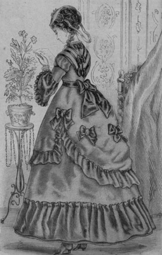
29. Нарядъ для вечера и для визитовъ для молодыхихъ дамъ.

28. Нарядъ для гулянья для молодыхихъ дамъ. Ро-