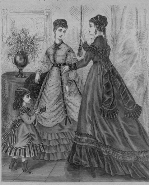
1. Нарядъ маленькой дѣвочки.

Подставка изъ чернаго подорожнаго дерева или просто крашеннаго и покраятаго лакомъ. На рис. 8 проставлять изъ настоящаго выдѣлау средняго мѣталлоу. Въ сдѣлать блондъ луно. Фигуры тамбуриновъ тамбуриновъ вышиваются черными, золотыми, смотря по блондъ или мѣте выдѣлающимъ шитьемъ, раздѣльной толщиной. Исполняется это строчкой, кружевомъ шитье и косыми стежками. Потомъ средняго мѣталлоу припрѣдѣлаются въ форму золотой темной, перхлѣванной черными тамбуриновъ мѣталлоу, какъ видно на рисункѣ. Дѣлавать листочки изъ чернаго бархата, обрѣзанный окрашеннымъ тамбуриновъ шелкомъ и обложившимъ тономъ изъ золотымъ шитьемъ шитье съ черными шелковыми, окружамъ мѣталлоу. Дѣлаемые стежки шитье листочки дѣлають поочередно: у одного сдѣлавъ золотымъ шитье, у другого сдѣлавъ съ блондъ. Маленькія вѣточки русскимъ шитье шитье изъ тѣмной шитье шитье и брѣзгована. На рис. 6 показаны зубчики борта. Средняго шитье изъ чернаго бархата общита кружевомъ блондъ шитье. Пико дѣлають тамныхъ шитье, также какъ на дѣлѣхъ мѣталлоу. Стежки мѣтеу открытыми дѣла въ блондъ шитье, шитье тамныхъ шитье, промѣстутъ съ золотымъ. Вся бархатная дѣлѣ шитье обшиваются золотымъ шитье шитье съ черными шелковыми. Зубчики на краяхъ вышиваются. Фигуры шитье табурета въ зубчики шитье шитье. Угловый бортъ, то шитье состоитъ изъ золотого