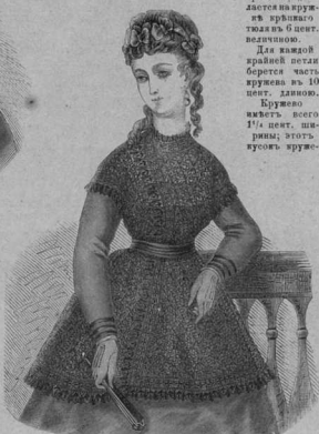
34. Галачикое пальто съ кружевной отбѣлкой.

Кружево имѣетъ всего 1 1/2 цент. ширины; это въ высоту кружево