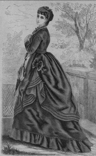
31. Нарядъ для вечера для дамъ среднихъ лѣтъ.

Послѣ одиннадцати оконченныхъ туровъ узоръ и слѣдующая за нимъ двухъ туровъ плот. петлями, вяжутъ первой туръ узоръ для передка, для котораго берутъ 12 петель, съ обѣихъ сторонъ нижней части сапожка. Верхняя же петли сапожка образуютъ пришивку. Весь передокъ состоитъ изъ четырехъ туровъ узоръ; въ каждомъ турѣ плотныхъ петель пропускаютъ по двѣ среднихъ петли, отчего передокъ оканчивается 10 плот. петлями. Подошва вяжется плотными петлями; она вымощивается точно также какъ вымощивается подошва къ сапожку изъ берберской шерсти; число петель также одинаково. Подошва и верхъ сапожка связываются въ нѣтъ плотными петлями. Вѣкъ сапожка оканчивается связаннымъ на снѣзкахъ бортикомъ, для котораго берется бумага, вымощиваютъ 4 петли и вяжутъ непрерывно, вымощиваютъ, на нитку убавить, пока не свяжутъ требующей длины борта. Нѣсколько петель бумаги соединяются въ рѣзку и ее пришиваютъ на передокъ сапожка. Продолжитъ въ сапожокъ шнурочекъ, оканчивающійся бумажной ниткой, на кончикъ шнурка украсаются кисточками; обивка шнурка проводится на одну сторону сапожка, тѣмъ она завязывается бантикомъ.