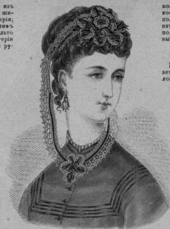
32. Чепчикъ-куфюра. См. также рис. 52.