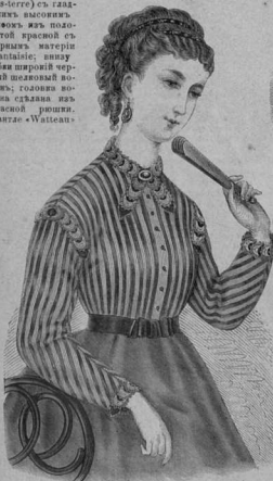
36. Рубашечка изъ вышитыхъ лентахъ съ омытой вышивкой отбѣлки. См. также рис. 34.

Платье (robe two-sets) съ галачикъ вышивки лентою изъ погонской красной съ черными материи fantaisie; внизу юбки широкій черный шелковый воланъ; головка юбки сдѣлана изъ красной рюшши. Мантия «Watteau»