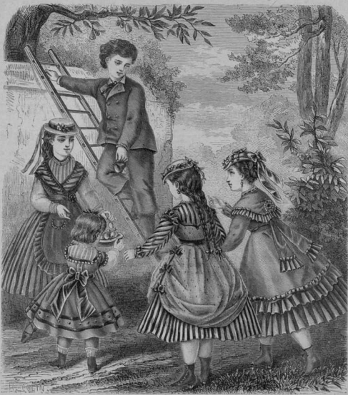
1. Нарядъ дѣвочки отъ 4-8 лѣтъ. 2. Нарядъ дѣвочки отъ 9-12 лѣтъ. 3. Нарядъ мальчика отъ 4-8 лѣтъ. 4. Нарядъ мальчика отъ 9-12 лѣтъ. 5. Нарядъ дѣвочки отъ 13-15 лѣтъ. 6. Нарядъ мальчика отъ 13-15 лѣтъ.

Наша модель в 37 цент. длины и 34 цент. ширины весьма красиво выдвигается на цветной флажке.