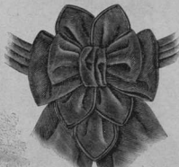
36. Огизла изъ пелю.

ваютъ цвѣтной тавтою и отдѣлываютъ маленькими бантиками, на крестъ положенными кончиками бархата, розетками, и иногда даже съ одного боку тузаками цвѣтовъ. Широкия завязки вышиваются свиди большими бантами.