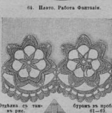
64. Плато. Работа Фантазия

завртугленіе и отдѣлка волона обозначены одинаковыми цифрами и точками; при выкраиваніи для головки волана въ 2 цент. припускають матерію вдвое.