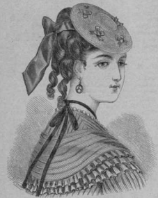
33. Шляпка „Chinoise“.

и съ изнанки по серединѣ немного зашиваютъ, съ, отчего образуется маленькая складка цвѣта.