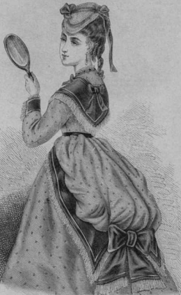
35. Костюмъ съ рапелъ и шпосомъ. Выкройка рапелъ съ шпосомъ. Праг. стор. Прагем. № 14, кат. 12-13.