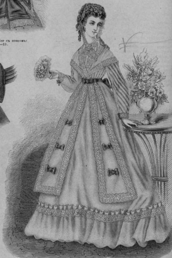
36. Матеріа „Marie Antoinette“ съ вышиваніемъ. Выкройка: Праг. стор. Прагем. № 2, кат. 4-5, 6-11. См. также рис. 32.

полосокъ, влятъ; при матросскомъ костюмѣ необходимо полосатое же платье. На выг. 17 дана полонина воротника, который выкраивается изъ двойной матеріи; такой воротникъ удобнѣе пришить въ шениметъ посредствомъ обшивочки. Галстужекъ дѣлается отдѣльно, и именно, оба конца вѣсятъ; на выг. 18 дана ихъ форма; они вляются изъ бастиста и вѣсь обмыночно при галстужкахъ новъ остается на изнанкѣ. По выг. 18 крестъ кладется на точку, отчего на серединѣ обложки вышнотъ галстужка образуется складочка, которую прикрываютъ маленькій обшивочкой въ видѣ узелка.