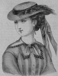
34. Шляпка и воротничекъ съ галстужоу „сано-тичъ“. Выкройка воротничка: Праг. стор. Прагем. № 6, кат. 17-18, крестъ, таво.

Подходящій въ шляпѣ широкій матросскій воротничекъ, дѣлается изъ полотно; концы воротника лежатъ на плечахъ; спереди воротникъ пере-вязанъ изъ видъ галстужка; задній воротникъ обшивается кругомъ полоской въ 1; центъ изъ по-досатаго ситца бѣлаго съ черными или же въ цвѣтѣ