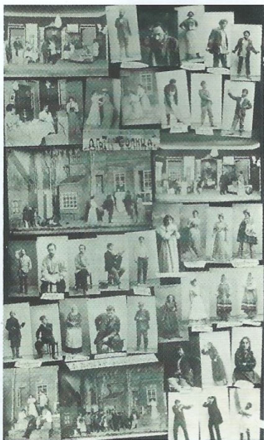
▲ Репертуар театра Комиссаржевской и его актерский состав. В Драматическом театре шли пьесы модного в то время Горького: «Дачники» (1904) и «Дети солнца» (1905), в которых главные роли – Варвары Михайловны в первой и Лизы во второй – исполняла сама Вера Федоровна. Также здесь ставились спектакли по Чехову, Ибсену и Метерлинку