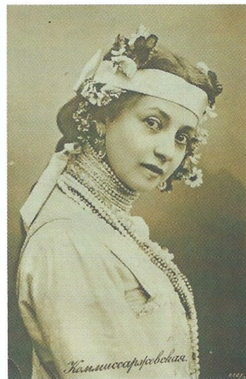
▲ В.Ф. Комиссаржевская в роли Снегурочки в одноименной пьесе А.Н. Островского. Эта работа актрисы вызвала весьма противоречивые отзывы. Многие считали, что данный образ в исполнении Веры Федоровны оказался неудачным, как, впрочем, и другие роли артистки из классического репертуара

Недовольство Комиссаржевской репертуаром всё возрастало. Некоторое разнообразие вносили лишь летние гастрольные труп-