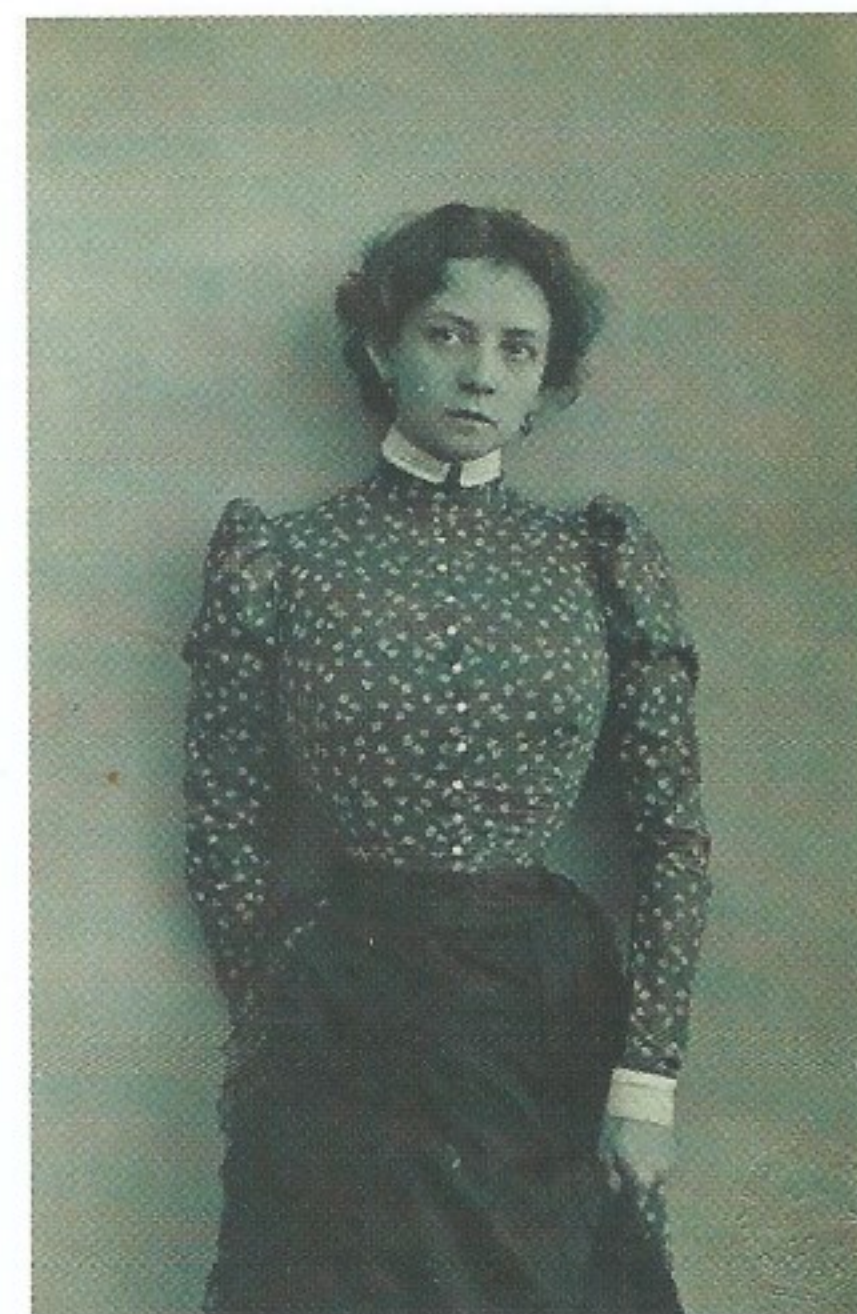
▼ Рано выйдя замуж и испытав горечь измены и предательства, Вера Федоровна в будущем отклоняла все предложения руки и сердца. Комиссаржевская – Марикка в спектакле «Огни Ивановой ночи» Г. Зудермана

мысль о замужестве, она даже мечтательно делилась с сестрой: вот встретится ей миллионер, влюбится в нее и сделает предложение, а она ответит ему: «Да, я согласна, но только если вы обеспечите на всю жизнь сестру и мамочку...». Правда, когда Надежда колко замечала: «А если он старый, лысый, безобразный, как в песенке Мусоргского?» – диалог тут же угасал. (В скобках отметим, что Надежда Федоровна также стала известной актрисой, которая выступала под сценическим псевдонимом Скарская.)