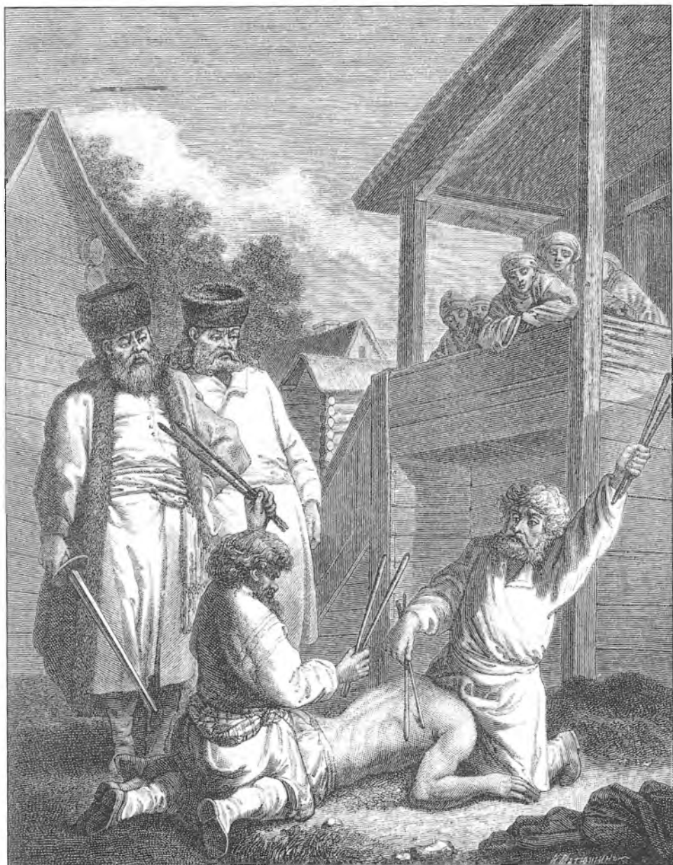
Наказание батогами в России в XVIII веке