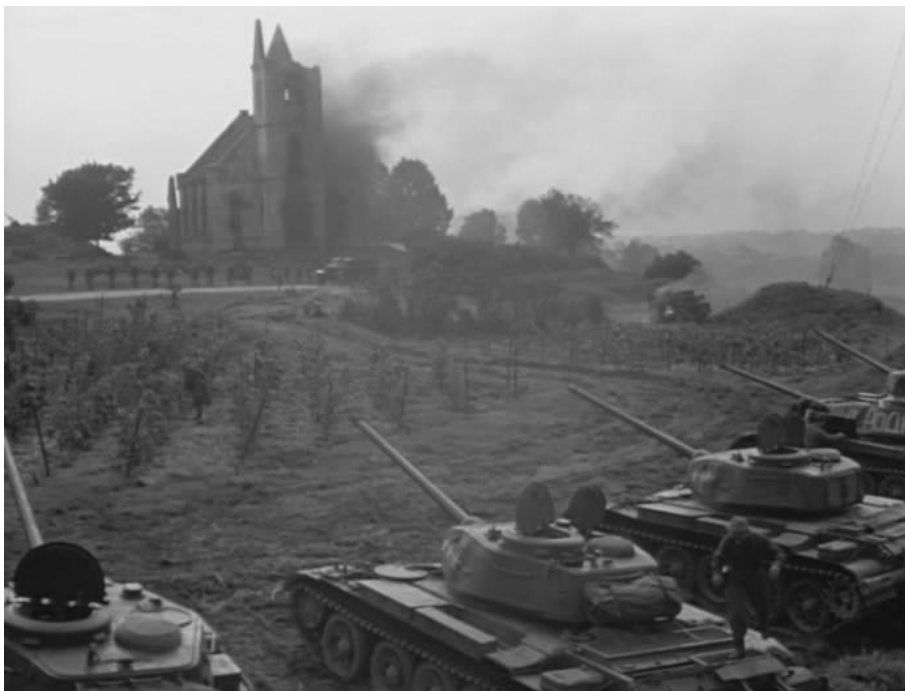
Кадры из фильма «Отец солдата»

Т-44 успешно сыграли роль тридцатьчетвёрок и в жизни, и в кино. Например, в известном советском фильме «Отец солдата», снятом в 1964 году на грузинской киностудии. Как знать, возможно появление Т-44 на экране было не случайно. Ведь в то время на ходу было ещё немало тридцатьчетвёрок.