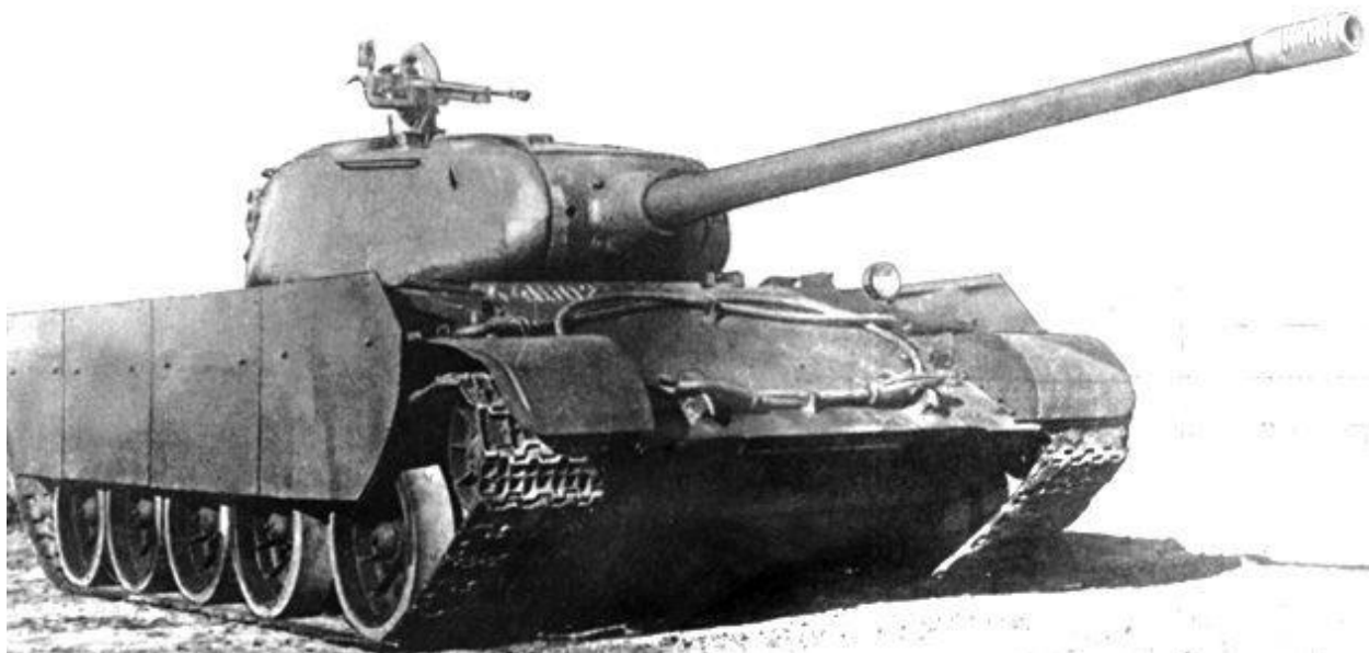
Т-44-100, вооружённый орудием ЛБ-1

Единственной причиной столь длительной задержки наступления может быть только отсутствие необходимого количества техники, и прежде всего танков. А нехватка танков в 1944 году могла быть вызвана переналадкой производства под выпуск новых образцов.