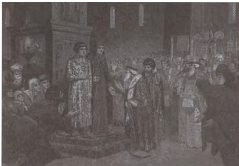
Избрание Михаила Фёдоровича Романова на царство. Художник А.Д. Кившенко