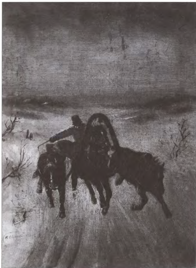
Ямщик на тройке. Художник Н.Е. Сверчков