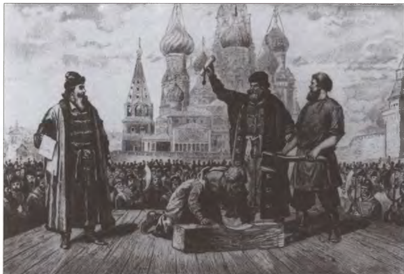
Помилование Лжедмитрием князя Василия Шуйского перед казнью. Художник А. Земцов