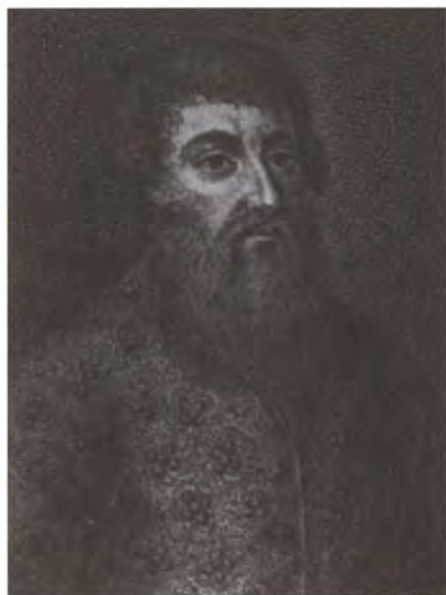
Князь Д.Т. Трубецкой. Неизвестный художник