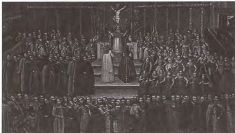
Свадьба Марины Мнишек и Лжедмитрия I. Неизвестный художник