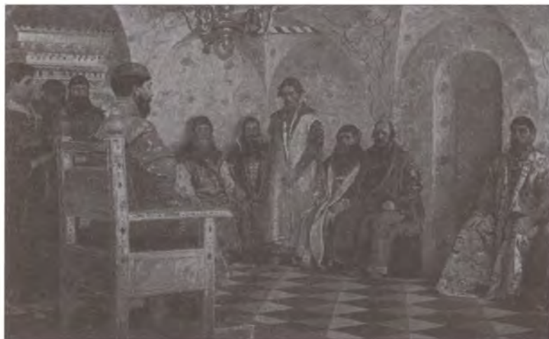
Сидение царя Михаила Фёдоровича с боярами в его государственной комнате. Художник А.П. Рябушкин