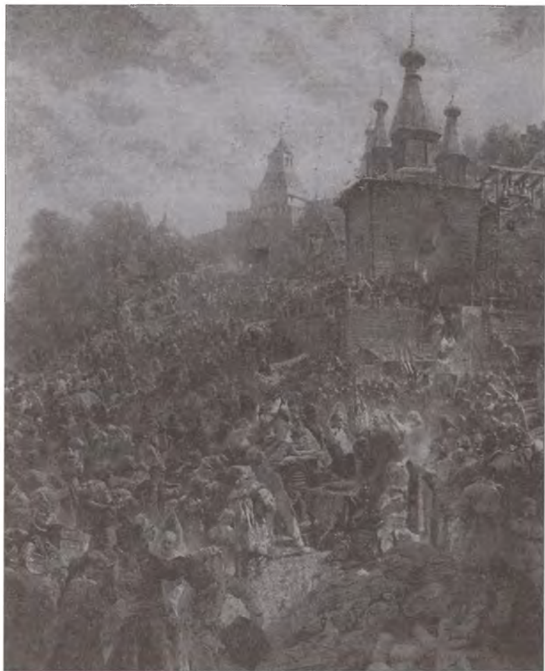
Минин на площади Нижнего Новгорода, призывающий народ к пожертвованиям. Художник К.Е. Маковский