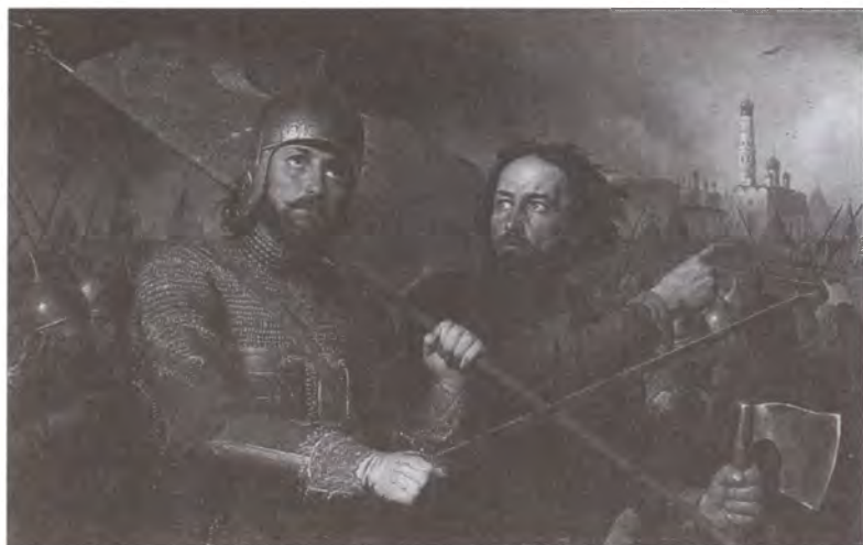
Минин и Пожарский. Художник М.И. Скотти