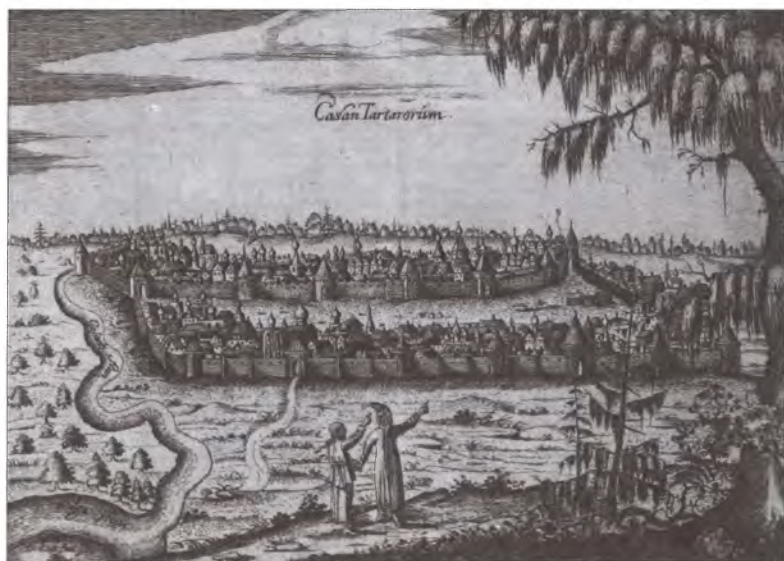
Вид Казани в XVII в.