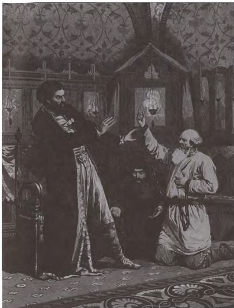
Боярин Борис Годунов и кудесники, предсказывающие ему царствование. Художник А.Д. Кившенко