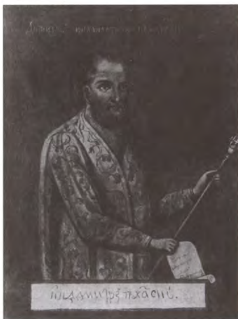
Князь Д.М. Пожарский. Портрет XVII в.