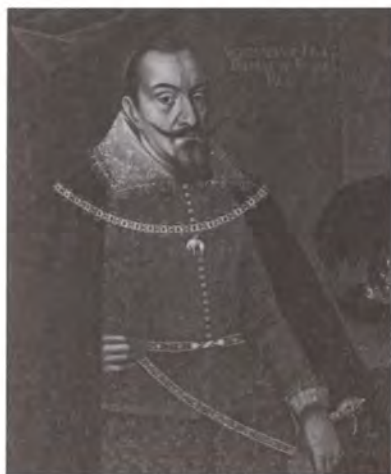
Сигизмунд III Ваза. Неизвестный художник