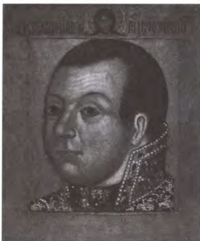
М.В. Скопин-Шуйский. Парсуна XVII в.