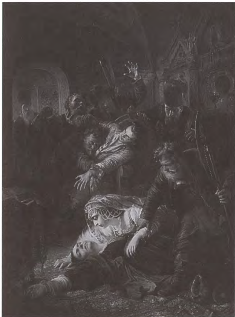
Агенты Лжедмитрия убивают сына Бориса Годунова. Художник К.Е. Маковский