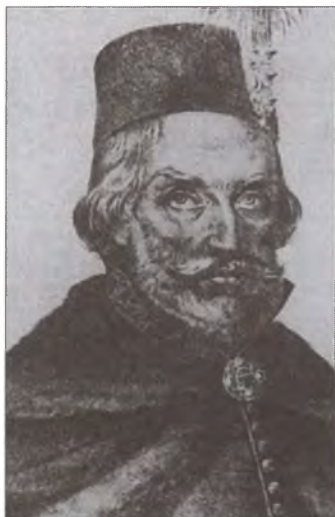
С. Жолкевский. Гравюра XIX в.