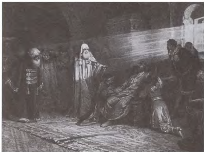
Смерть Бориса Годунова. Художник К.В. Лебедев