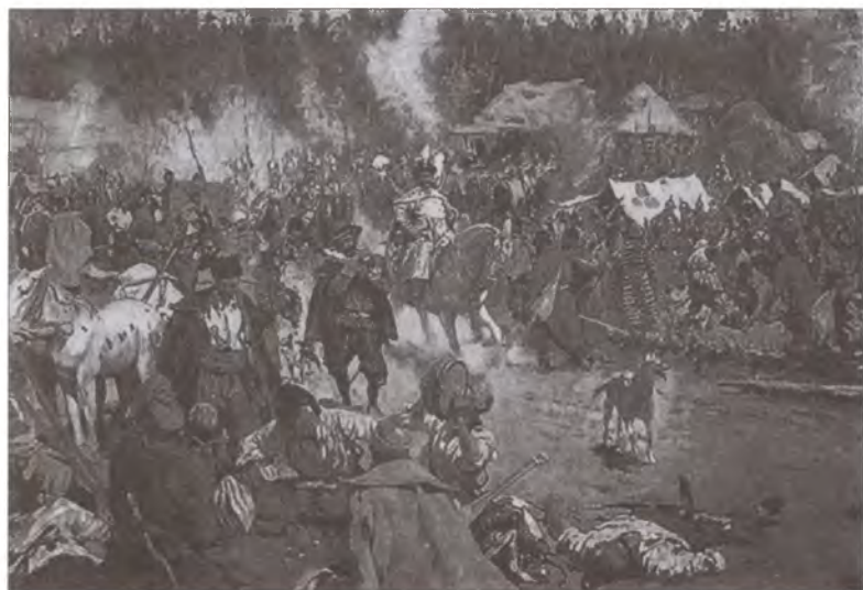
В Смутное время. Художник С.В. Иванов