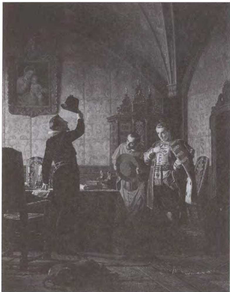
Присяга Лжедмитрия I польскому королю Сигизмунду III на введение в России католицизма. Художник Н.Е. Неврев