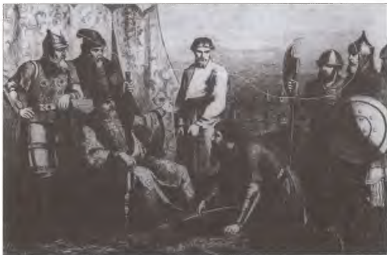
Болотников является с повинной перед Василием Шуйским. Гравюра XIX в.