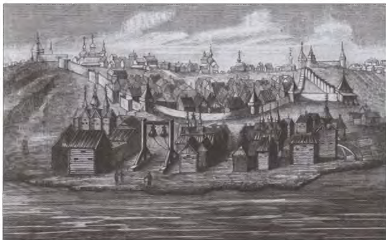
Нижний Новгород в XVII в. Из книги «Родная старина. Отечественная история в рассказах и картинах»