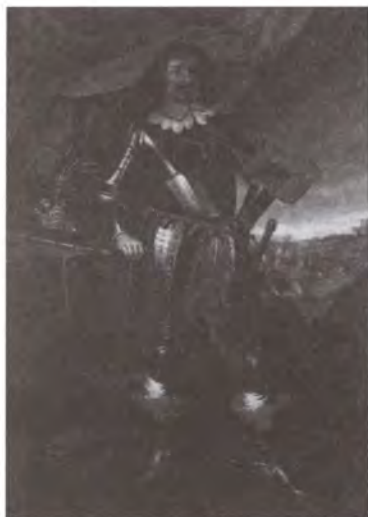
Владислав IV. Неизвестный художник