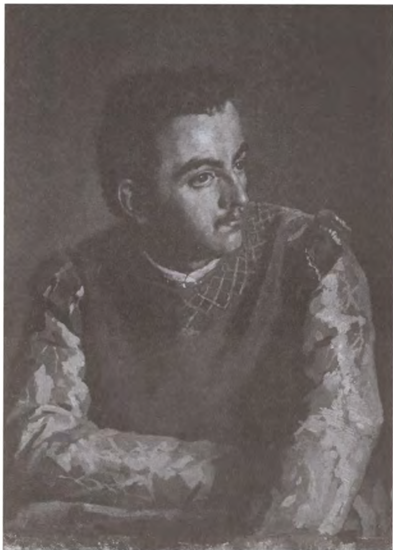
Лжедмитрий. Художник Н.Е. Неврев