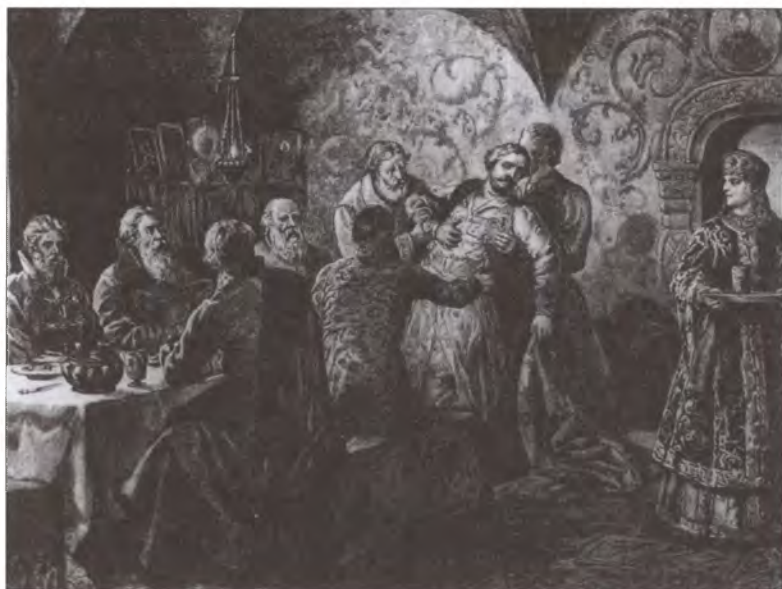
Князь М.В. Скопин-Шуйский умирает на пиру. Гравюра XIX в.