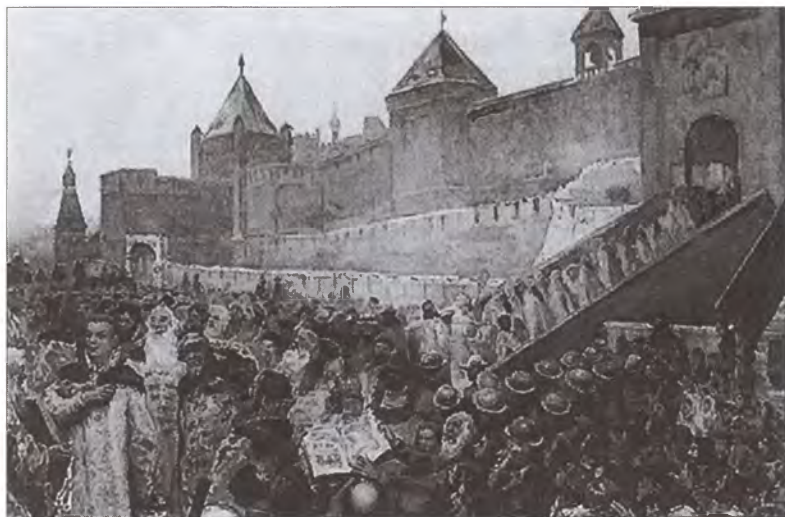
Въезд Лжедмитрия в Москву 20 июня 1605 года. Художник К.В. Лебедев