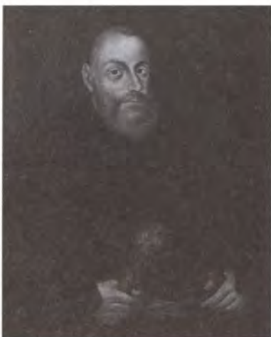
Я.-К. Ходкевич. Неизвестный художник