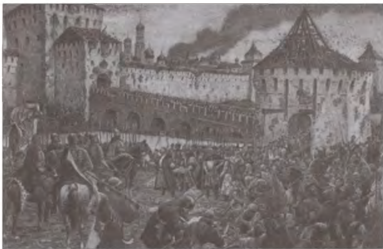
Изгнание польских интервентов из Московского Кремля в 1612 г. Художник Э.Э. Лиссенер