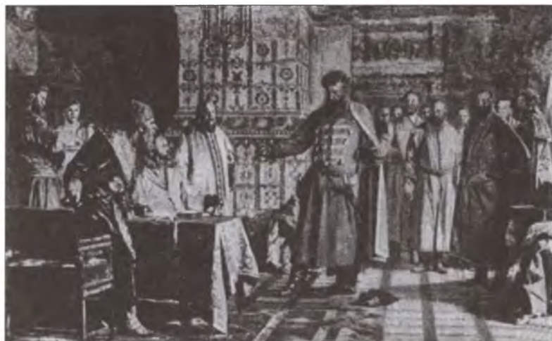
Ляпунов с дворянами свергает царя Василия Шуйского. Художник Н.В. Неврев