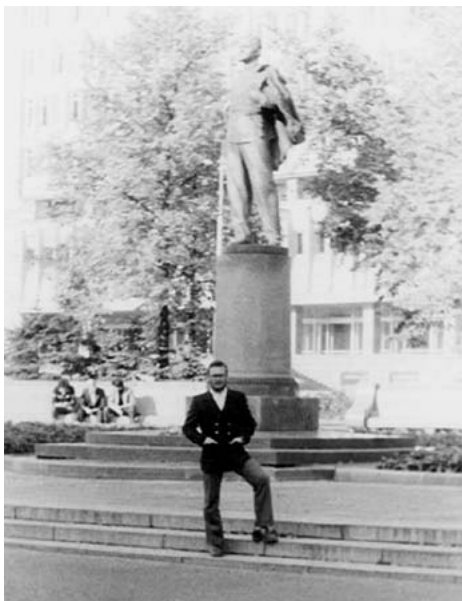
1 курс. Автор на «Сковородке»

Напротив главного здания университета был поставлен памятник в окружении цветочной клумбы: молодой Володя Ульянов, забросив через плечо сюртук униформы КИУ, с книгой в руке идёт на занятия. За памятником полукругом большая скамья со спинкой на мраморном постаменте. Это место неофициально зовётся «Сковородкой» и очень популярно среди студентов: оно никогда не затенено, за ним небольшой сквер, очень удобный для встреч. Фразу «встретимся на Сковородке» я слышал и говорил сам несчётное количество раз. У брачующихся студентов университета стало традицией приезжать свадебным кортежем на «Сковородку» и возлагать к памятнику знаменитого студента цветы с обязательным фотографированием.