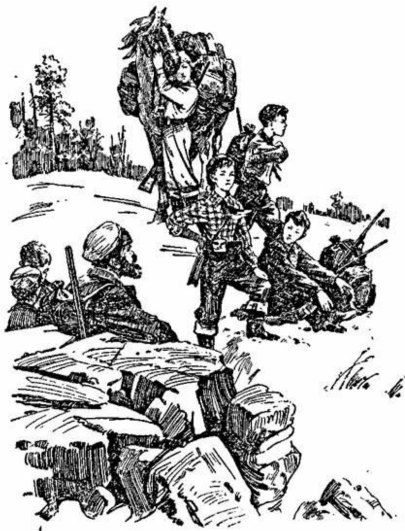
Ребята жадно смотрели на север. За какой горой, где она, Золотая падь?

Экспедиция остановилась на короткий привал. Дедушка велел поднять повыше голенища бродней и застегнуть тужурки. Впереди был снег. Необычно было видеть его летом. Он так сверкал под солнцем, что слепил глаза. Ни дерева, ни кустика впереди — одна голая белая сверкающая равнина. Разноголосο журча, из-под снега вытекали ручейки и терялись в камнях. Между ними кое-где робко голубели подснежники. Да, здесь, почти на вершине хребта, еще только начиналась весна.