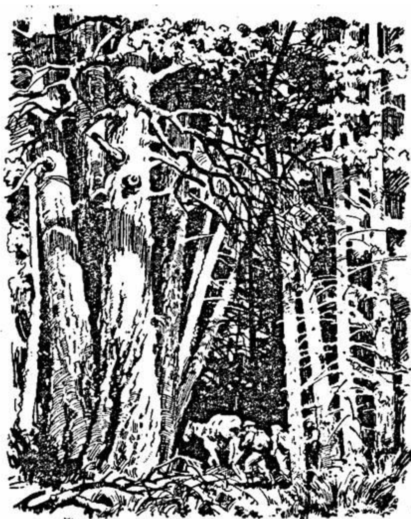
Начался такой лес, какого ребята еще не видывали.

Тропа петляла, обходя столетние могучие великаны, валежины, пни.