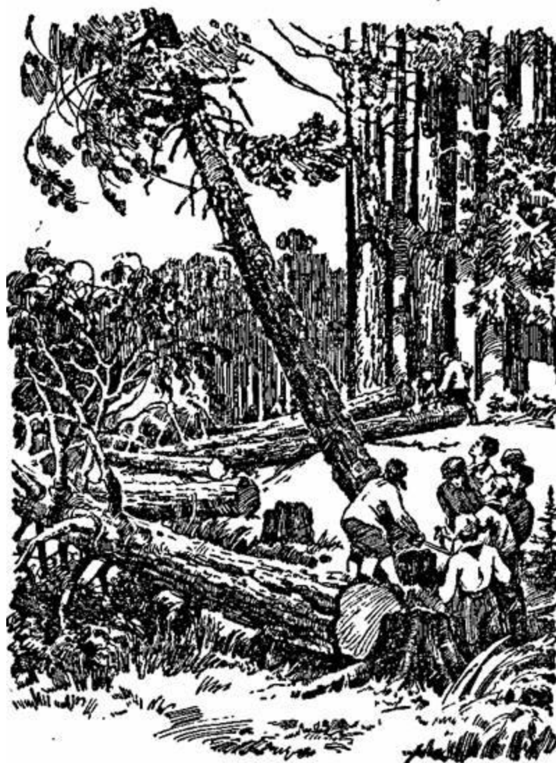
Прошло не больше минуты. Сосна накресталась и с приглушенным гулом рухнула на землю.

ребят. Но сейчас, когда они направились к нему, сделал вид, что даже не замечает их.