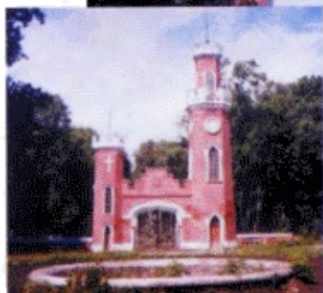
Замок принцессы Ольденбургской (г. Рамонь, Воронежская обл.)